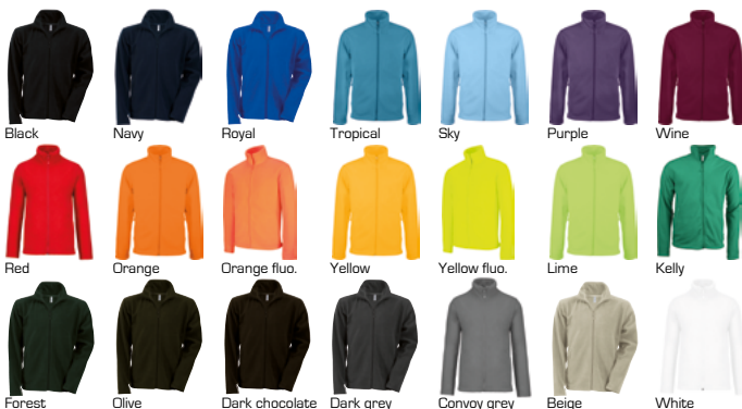
Black Navy Royal Tropical Sky Purple Wine Red Orange Orange fluo. Yellow Yellow fluo. Lime Kelly Forest Olive Dark chocolate Dark grey Convoy grey Beige White