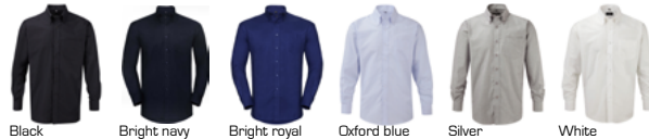
Black Bright navy Bright royal Oxford blue Silver White